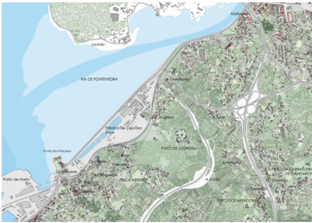
Plano de situación e estado actual do ámbito de Lourizán na ría de Pontevedra · Jorge Rodríguez