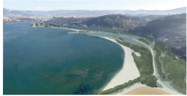
Vista aérea desde o suroeste antes da proposta e segundo a proposta

truturas. O Porto de Marín é un porto do Estado con acceso directo á autoestrada AP-9 a través da autovía estatal PO-11 e tamén conta cunha conexión ferroviaria directa ao corredor Coruña-Vigo. Os fluxos de tráfico superan os 20.000 vehículos ao día na autovía, fronte aos 5.000 do tramo da vía autonómica que discorre polo interior (PO-546). Polo tanto, calquera proposta viable debe ter en conta a necesaria conectividade do porto. As propias vías de comunicación causaron un gran impacto nos núcleos de poboación, especialmente nos Praceres, que foi atravesada pola autovía, que discorre a escasos 5 metros da igrexa. Ademais, a vía do tren atravesaba a praza principal do núcleo.