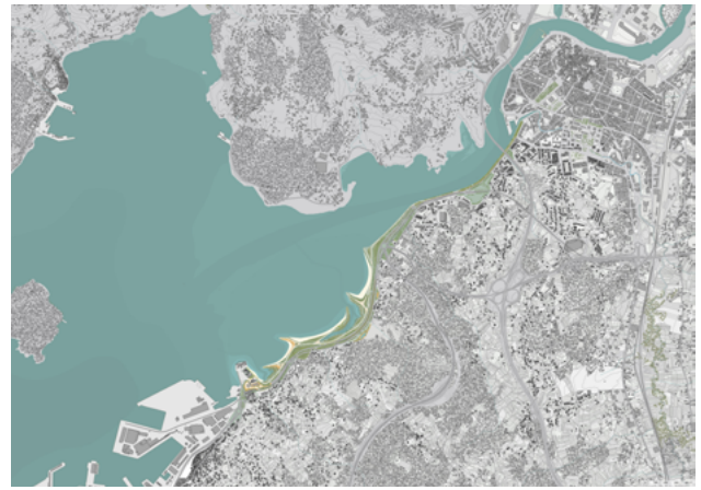
Plano xeral do proxecto de re-naturalización de Lourizán, en relación coa ría e coa cidade de Pontevedra · Jorge Rodríguez