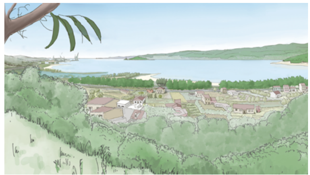
Vista actual desde o Monte do Sino, nos xardíns do Pazo de Lourizán, e vista segundo a proposta · Jorge Rodríguez

A presenza da fábrica de Ence na ría de Pontevedra é un vestixio dun paradigma industrial obsoleto, centralista e autoritario, baseado na negligencia ambiental e o desprezo pola comunidade local. A construción da fábrica de pasta de papel Celulosas, entre os anos 1958 e 1963, non só sepultou o banco marisqueiro máis produtivo da ría, senón que tamén botou a perder unha incipiente actividade turística nunha contorna privilexiada, que mesmo Otero Pedrayo describira coma unha "síntese admirable da Paisaxe Galega" 1 . A oposición local á fábrica iniciárona as mariscadoras, que sufriron a perda do seu sustento coas obras de recheo. Unha forte represión silenciou as protestas durante a ditadura, malia os evidentes impactos negativos da actividade da Celulosa na contorna, caracterizados polo seu cheiro, pero tamén polos vertidos na ría e a súa influencia na propagación do monocultivo de eucalipto en toda Galicia 2 . A oposición á fábrica retomou visibilidade coa chegada da democracia, a través de asociacións ecoloxistas, destacando a Asociación Pola Defensa da Ría (APDR), que desde 1987 vén desenvolvendo numerosas accións de concienciación e estudos para esixir o traslado da fábrica fóra da ría.