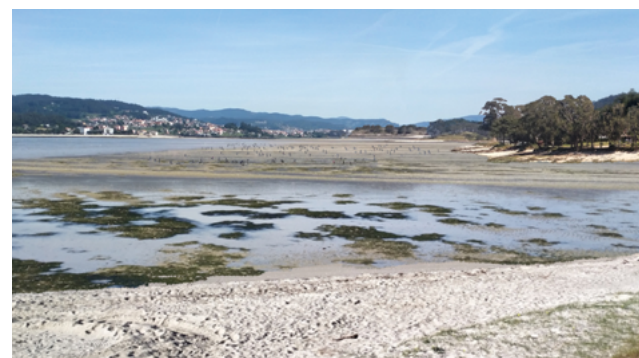
Vista actual desde a pasarela peonil dos Praceres e vista segundo a proposta · Jorge Rodríguez